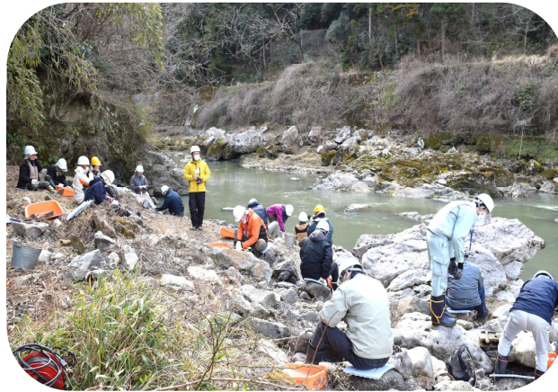
岩塊を割って調べる参加者たち

丹波市恐竜課が主催する化石試掘調査が、元気村かみくげ近くの篠山川河川敷で3月3日から8日までの6日間実施されました。調査には県内各地から延べ150人以上のボランティアが参加して、骨片や貝の化石など126点が発掘されました。その中には肉食恐竜の歯2点や、ワニの歯など貴重なものも含まれ、成果の大きい調査になったと思います。