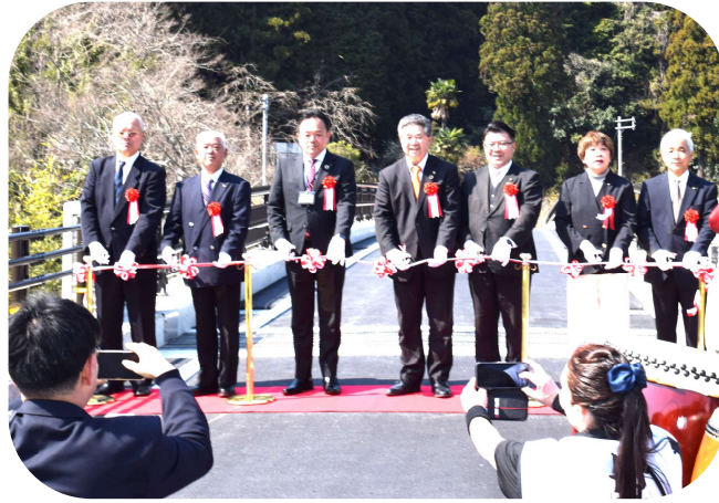
来賓らによるテープカット