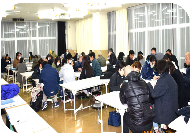
考える会はランチルームで開催

ている状況となっています。自治協議会として小学校の今後について地域の意見を取りまとめる必要があるため、1月27日に、希望者に参加してもらって「上久下小学校の今後について」考える会を開催しました。約40人の参加者には、子育て世代とOB世代のグループに分かれ活発に意見交換をしてもらいました。更に全戸にアンケート用紙を配布して、当日参加できなかった人たちの意見も集約しました。アンケートの回収数は188件で、統合に賛成する意見（どちらかと言えばを含めて）が167件、反対する意見が21件という結果でした。主な賛成意見として「少子化で止む無し」「大勢の中で切磋琢磨して欲しい」「元々こども園で久下・小川の子と一緒に過ごしている」という内容でした。反対意見では「地域から小学校が消えるのは辛い」「安全な通学だけは配慮して欲しい」等の意見があり、「何とか存続させることはできないのか」というような切実な思いもありました。考える会でも統合に賛成する意見が多くを占め、上久下としては統合について山南他地区や教育委員会と調整を図っていくこととなります。