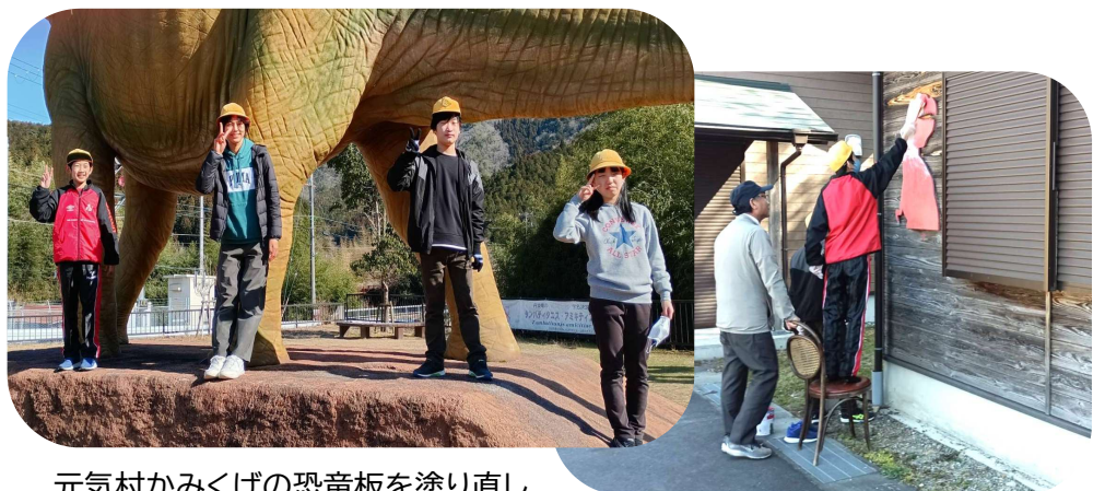
元気村かみくげの恐竜板を塗り直し