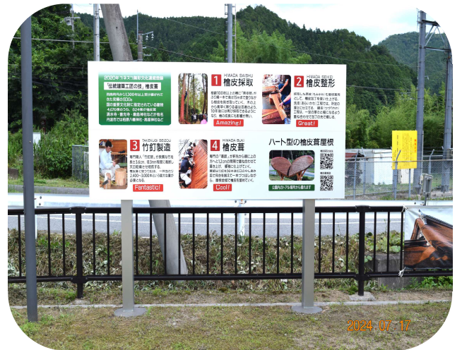
檜皮葺あずま屋側