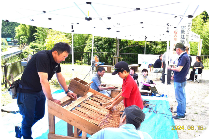
檜皮屋根葺きの体験