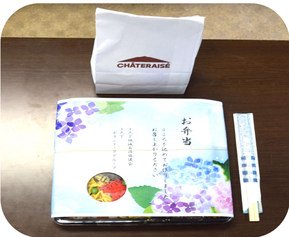
お弁当・おやつセットが宅配されました